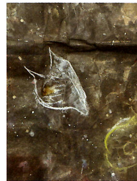
「ふたつの太陽」(プランクトン部分)